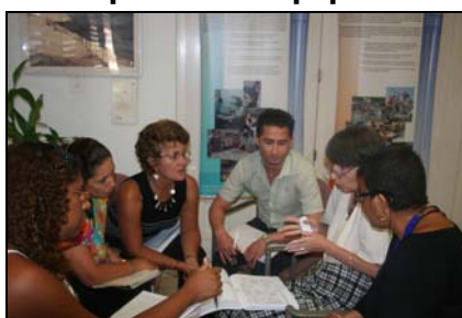
Participantes del Equipo 2.