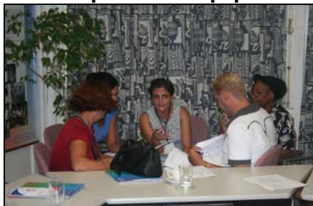
Participantes del Equipo 1.