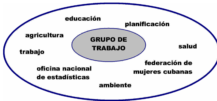
Figura1: Composición de los Grupos de Trabajo Provinciales y Municipales

Los estudios territoriales participativos fueron hechos por los Grupos de Trabajo de las tres áreas piloto y sucesivamente sintetizados en documentos llamados “Líneas Directrices del desarrollo humano sostenible en el ámbito local”. Estos documentos de análisis y de síntesis de las problemáticas y de las potencialidades del territorio fueron realizados mediante la investigación y el análisis de los datos, de la documentación existente, de los planes de desarrollo de los ministerios competentes, de los programas en curso en los cinco sectores de acción del desarrollo humano. Para su realización se hicieron también entrevistas a fuentes oficiales y no oficiales, durante actividades con la participación de maestros, de las asociaciones de familias de alumnos, de representantes de la Federación de Mujeres Cubanas, de los grupos para el medio ambiente, de los representantes elegidos de circunscripción, de los campesinos y de las pequeñas cooperativas, del sindicato para la tercera edad, de los médicos, las enfermeras, los pacientes de dispensarios y de policlínicos. Una fase sucesiva relevante para la definición de las “Líneas Directrices de desarrollo local” fue el análisis ínter - sectorial de los datos, con el fin de dar mejores respuestas desde el punto de vista de la calidad a las necesidades locales, con un ahorro de recursos humanos y financieros. Se trata de un método que los interlocutores cubanos consideran como un aporte fundamental del PDHL.