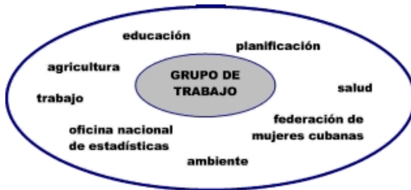
Figura1: Composición de los Grupos de Trabajo Provinciales y Municipales

Los estudios territoriales participativos fueron hechos por los Grupos de Trabajo de las tres áreas piloto y sucesivamente sintetizados en documentos llamados “Líneas Directrices del desarrollo humano sostenible en el ámbito local”. Estos documentos de análisis y de síntesis de las problemáticas y de las potencialidades del territorio fueron realizados mediante la investigación y el análisis de los datos, de la documentación existente, de los planes de desarrollo de los ministerios competentes, de los programas en curso en los cinco sectores de acción del desarrollo humano. Para su realización se hicieron también entrevistas a fuentes oficiales y no oficiales, durante actividades con la participación de maestros, de las asociaciones de familias de alumnos, de representantes de la Federación de Mujeres Cubanas, de los grupos para el medio ambiente, de los representantes elegidos de circunscripción, de los campesinos y de las pequeñas cooperativas, del sindicato para la tercera edad, de los médicos, las enfermeras, los pacientes de dispensarios y de policlínicos. Una fase sucesiva relevante para la definición de las “Líneas Directrices de desarrollo local” fue el análisis ínter - sectorial de los datos, con el fin de dar mejores respuestas desde el punto de vista de la calidad a las necesidades locales, con un ahorro de recursos humanos y financieros. Se trata de un método que los interlocutores cubanos consideran como un aporte fundamental del PDHL.