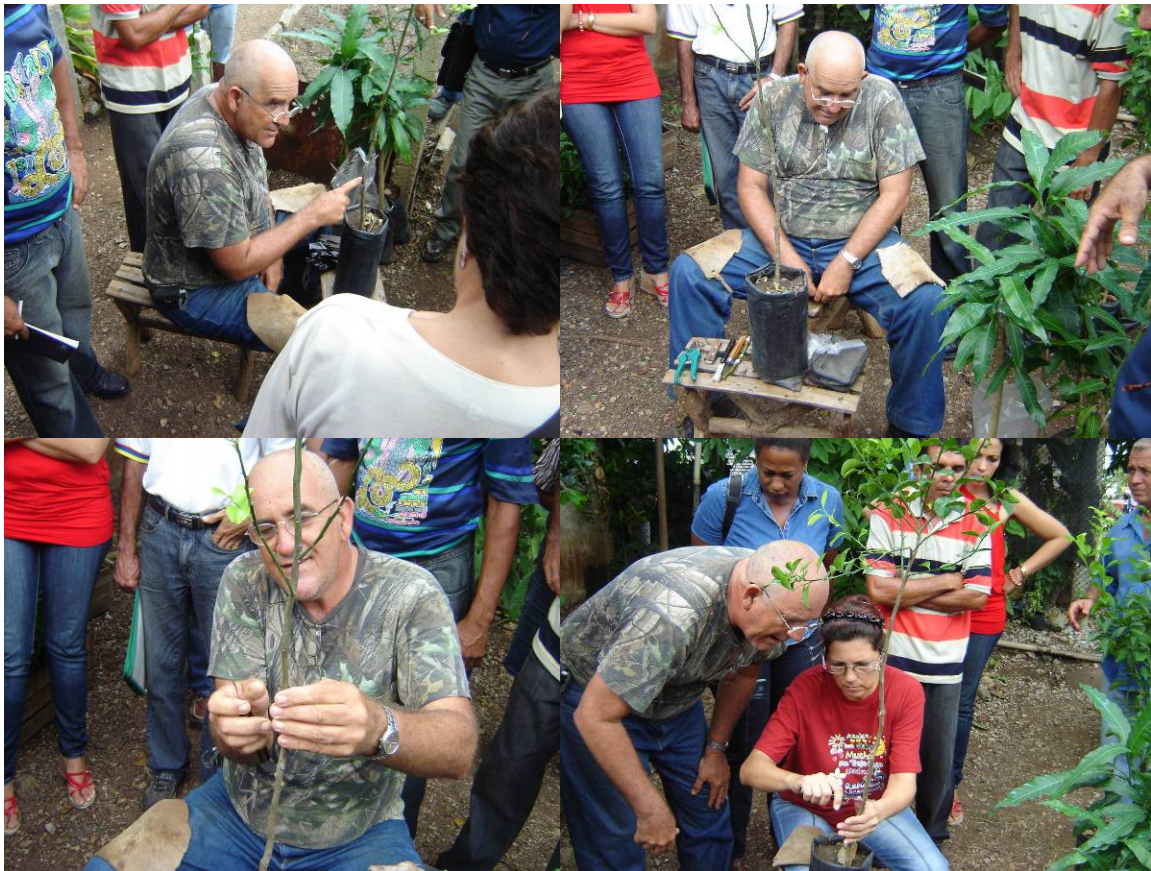
CLASE PRACTICA DE INJERTO DE FRUTALES