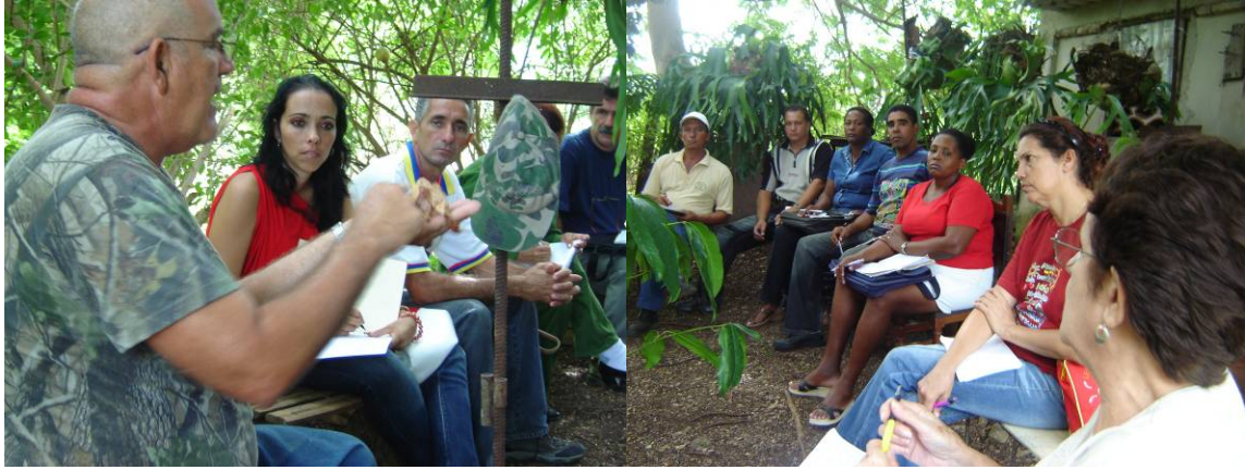
MOMENTOS DEL TALLER DE FRUTICULTURA