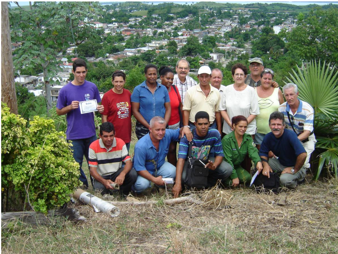
PARTICIPANTES DEL TALLER DE FRUTICULTURA CELEBRADO EN LA CASA DE TELLO, AL FONDO LA CIUDAD DE BAHIA HONDA Y EN EL EXTREMO DERECHO DEL GRUPO UNA PALMA PETATE

Realizada visita de monitoreo y seguimiento al proyecto “ Conservación de la Palma Petate ( Coccothrinax crinita subsp. crinita ) como recurso tradicional exclusivo de la comunidad de Las Pozas, Bahía Honda, Pinar del Río, Cuba.