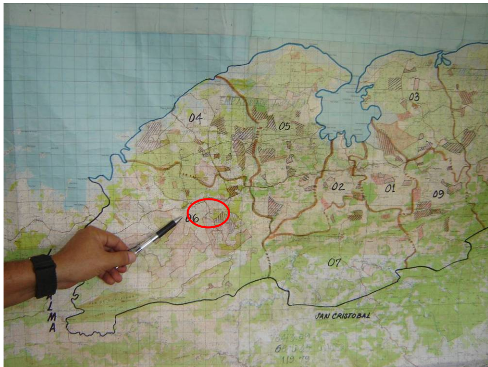
COMPRABADO EN LA OFICINA DE TENENCIA DE LA TIERRA EL EXPEDIENTE DONDE SE TRASPASA EL ÁREA, SEÑALADA EN EL MAPA.